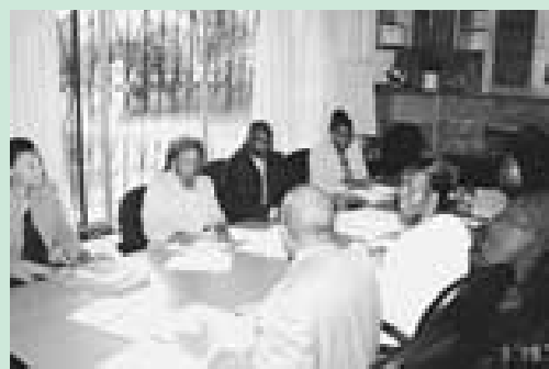
Miembros del Directorio: