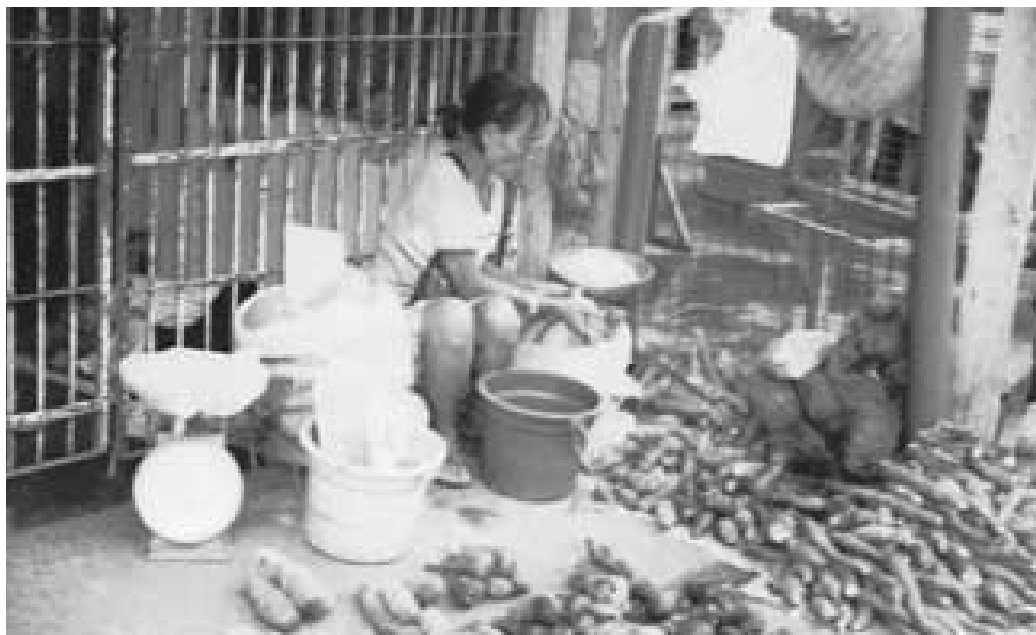
Un cliente de ECLOF en su puesto del mercado. La mujer es miembro de Barrera y Asociados, uno de los 47 grupos de solidaridad en Antipolo a quienes ECLOF Filipinas hizo préstamos en el año 2001. Cada miembro del grupo recibió un préstamo de ECLOF de 10PHP (200USD) para su negocio de ventas de legumbres.

Casi tres años atrás, ECLOF Filipinas comenzó un nuevo alcance de su programa. El trabajo está ahora dando sus frutos y han abierto recientemente dos de sus nuevas sucursales en áreas de comunidades extremadamente pobres.