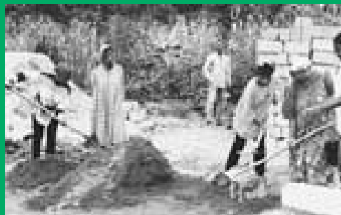
Trabajo duro y compromiso, más un préstamo de ECLOF, posibilitan casas nuevas en Camerún.

Es por esto que la Mutual solicitó un crédito de ECLOF de 48.000USD para incrementar su capital de préstamos y acelerar las operaciones de construcción. Actualmente, en lugar de tener que esperar su turno, todos los miembros pueden comenzar la construcción de sus casas y lo que acumulen a través del tiempo de las contribuciones de los miembros será utilizado para devolver el préstamo.