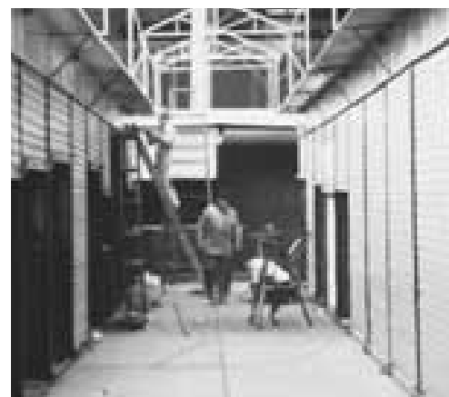
Dando los últimos toques a nuevos comercios, justo dos meses después del incendio que mató por lo menos a 300 personas y quemó 700 tiendas hasta los cimientos.

Como parte del programa integral de ayuda en caso de desastre de COEP, la Cruz Roja anunció que estaba poniendo a disposición