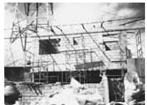
El Centro de Educación Cristiana de Calamba en construcción. La Iglesia negoció el contrato de construcción para pagar semanalmente al constructor un porcentaje del trabajo realizado. El saldo fue pagado cuando la construcción fue terminada.

El proyecto no fue diseñado para general beneficios pero a través de la recaudación de alquileres como por los ahorros que