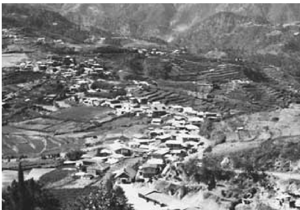
Buguias se encuentra a 330 kilómetros al norte de Manila, en la isla de Luzón, en la zona de la Cordillera, a una altura de más o menos 1.700 metros sobre el nivel del mar. Buguias tiene una población de un poco más de 33.000 habitantes en 14 aldeas (barangays). Se llega desde Manila en ocho horas de coche debido a que la carretera es particularmente difícil, sin asfalto y con muchas curvas.

Los clientes pagan ambas primas, cuyo total es de solamente 3%, de la suma prestada. Considerando que el término del préstamo es de 120 a 180 días, esto es muy razonable.