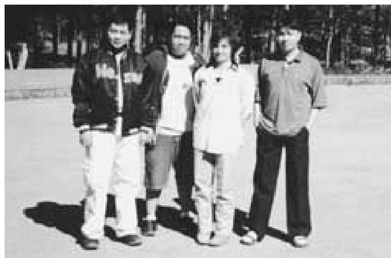
Miembros del Programa de Producción de Verduras de ECLOF en Buguias. La agricultura es la principal industria y fuente de vida de los habitantes del distrito, el que es el productor más grande de verduras en la provincia.