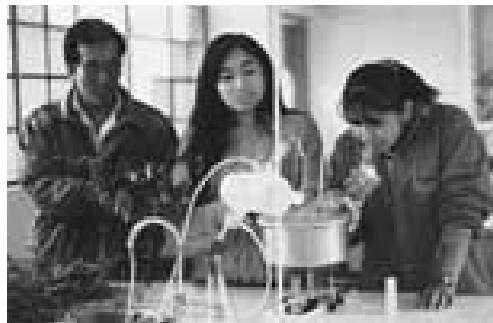
Los estudiantes de la Escuela Niño Jesús de Praga han ganado un serie de premios por trabajos científicos incluyendo uno por la utilización de cáscara de frutas para producir pectina y otro por un proyecto de base de datos para mejorar el suelo y la cosecha en los Andes del Perú.

La escuela recibió su primer préstamo de ECLOF de 50.000USD en 1997 para completar la construcción de un gimnasio, una sala de juegos y laboratorios científicos. Nuevos Horizontes (No. 21, junio 1999) informó previamente sobre los resultados en ciencias y tecnología, los que principalmente eran sobre la agricultura en el área de Tarma.