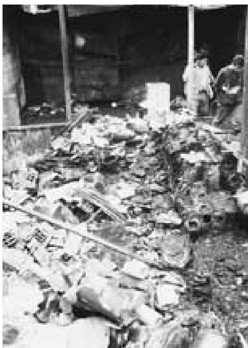
Reducidos a cenizas. Cientos de muertos y vidas arruinadas en la galería comercial de Mesa Redonda.

El 29 de diciembre del año pasado, muchos peruanos se encontraban en las calles de la capital, Lima, aprovechando de los saldos de fin de año o haciendo sus últimas compras para festejar el Año Nuevo. Los vendedores callejeros vendían fuegos artificiales para los festejos, cuando de pronto comenzó un incendio en uno de los puestos de venta que se expandió rápidamente perdiendo todo control. El resultado fue espantoso.