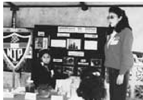
La Escuela del Niño Jesús de Praga tiene 370 estudiantes. Casi la mitad de los estudiantes recibe una beca completa o parcial. El costo mensual es de 18USD por mes.

El préstamo de ECLOF de 1997 fue relativamente menos que un tercio del total del costo del proyecto para agrandar la escuela. La devolución de préstamo fue por cuotas mensuales durante cuatro años. El record de la devolución del préstamo de la escuela ha correspondido con sus altos estándares académicos; todas las cuotas fueron pagadas a tiempo o por adelantado.